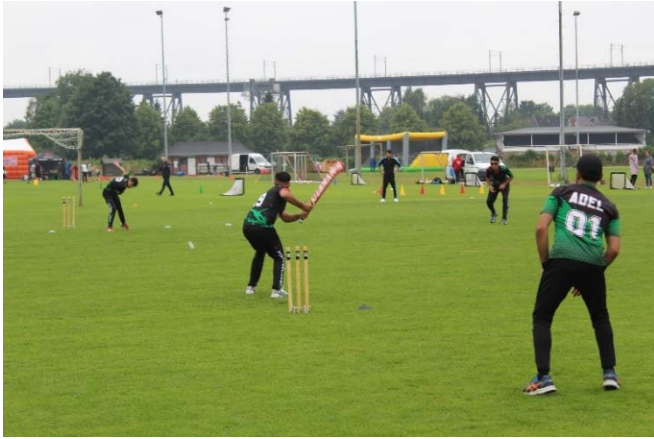
Foto: Kreissportfest auf dem Sportplatz Nobiskrug

Daneben wurde ein abwechslungsreiches Rahmenprogramm bestehend aus einem Freundschaftsspiel der Integrationsmannschaft MOIN FC und dem Brekendorfer TSV, Hüpfburgen, dem Hindernisparcours "Wipe-Out" und einem reichhaltigen Angebot an Speisen und Getränken zu günstigen Preisen zusammengestellt.