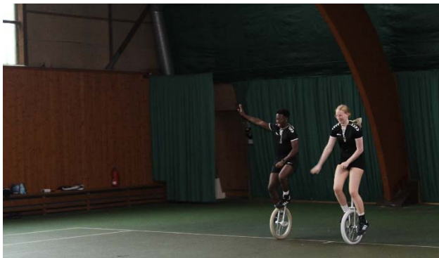
Foto: Das Weltmeister-Duo in Aktion