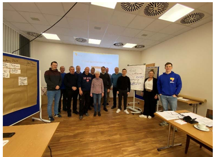
Foto: KSV Klausurtagung

Am zweiten Januarwochenende versammelte sich der KSV Vorstand mit seinen Beisitzern, in den Tagungsräumen des Hotels Schützenhof am Wittensee, um die Zukunftsstrategie für das Jahr 2024 zu erarbeiten. In dieser zweitägigen Maßnahme wurden die gesteckten Ziele des Vorjahres und deren Erfüllung geprüft sowie neue Ziele und entsprechende Maßnahmen für das Jahr 2024 entwickelt.