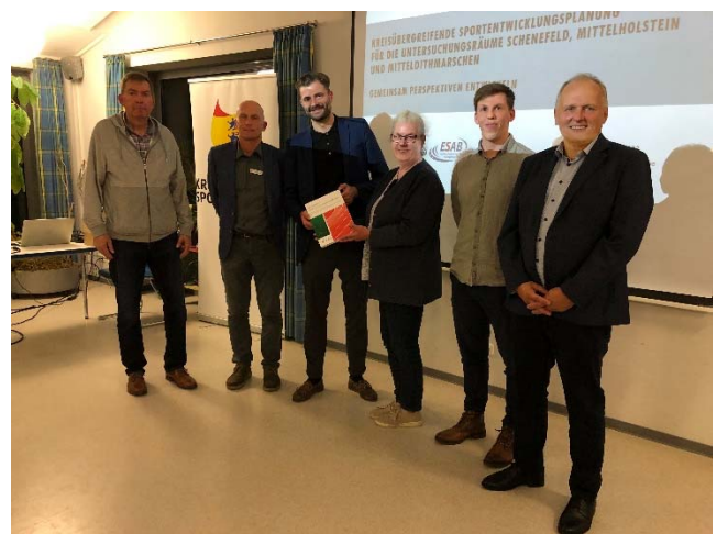
überreicht das Sportentwicklungsgutachten

Anfang Oktober 2022 wurde in der Schul-Mensa der Theodor-Storm-Gemeinschaftsschule in Hanerau-Hademarschen im Rahmen einer Ergebnisvorstellung durch das Wissenschaftsteam des Instituts für kommunale Sportentwicklungsplanung Potsdam das Gutachten über eine kreisübergreifende Sportentwicklungsplanung Rendsburg-Eckernförde, Dithmarschen und Steinburg überreicht. Seitdem verfügen die Ämter Mittelholstein, Schenefeld und Mitteldithmarschen über spezifische Handlungs- sowie Maßnahmenempfehlungen, mit denen es in den kommenden rund zehn Jahren die lokale Sport- und Bewegungslandschaft zukunfts- und bedarfsorientiert weiterzuentwickeln gilt.