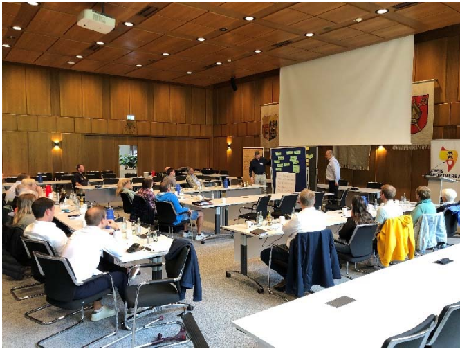
Foto: Workshop Perspektive Sport 2025

Nach der Auftaktveranstaltung im Jahr 2021 hat der KSV Vorstand auch in den Folgejahren 2022 (im Martinshaus in Rendsburg) und 2023 (im Kreishaus in Rendsburg) gemeinsam mit Vertretern der Politik, Wirtschaft, Kreisverwaltung und dem Sport an Themen der Sportentwicklung im Rahmen des Workshops Perspektive Sport 2025 gearbeitet. Ziel dieser Veranstaltungen ist es, gemeinsam anhand verschiedener Schwerpunktthemen auf aktuelle Herausforderungen und Chancen zielgerichtet einzugehen und somit die Sportlandschaft zukunftsgerecht aufzustellen.