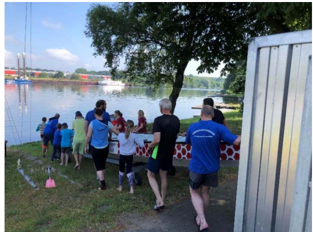
Foto: Team-Event beim Rendsburg Kanu-Club

Auch in den vergangenen beiden Jahren hat die Sportjugend versucht, Kinder und Jugendliche sowie Aktive in der Jugendarbeit in Form von sogenannten Team-Events zusammenzubringen und den Austausch verschiedener Vereine untereinander zu fördern. So waren wir Ende 2022 zu Gast bei den Urban Apes in Kiel, wo über 30 Kinder und Jugendliche sowie deren Übungsleiter und Trainer aus sechs Vereinen Bouldern ausprobieren konnten und die Zeit des Verschlaufens genutzt haben, um sich auszutauschen. Im Sommer 2023 hat der Rendsburger Kanu-Club seine Pforten geöffnet und den Teilnehmern verschiedene Bootsklassen zum Ausprobieren zur Verfügung gestellt. Im Anschluss blieb –